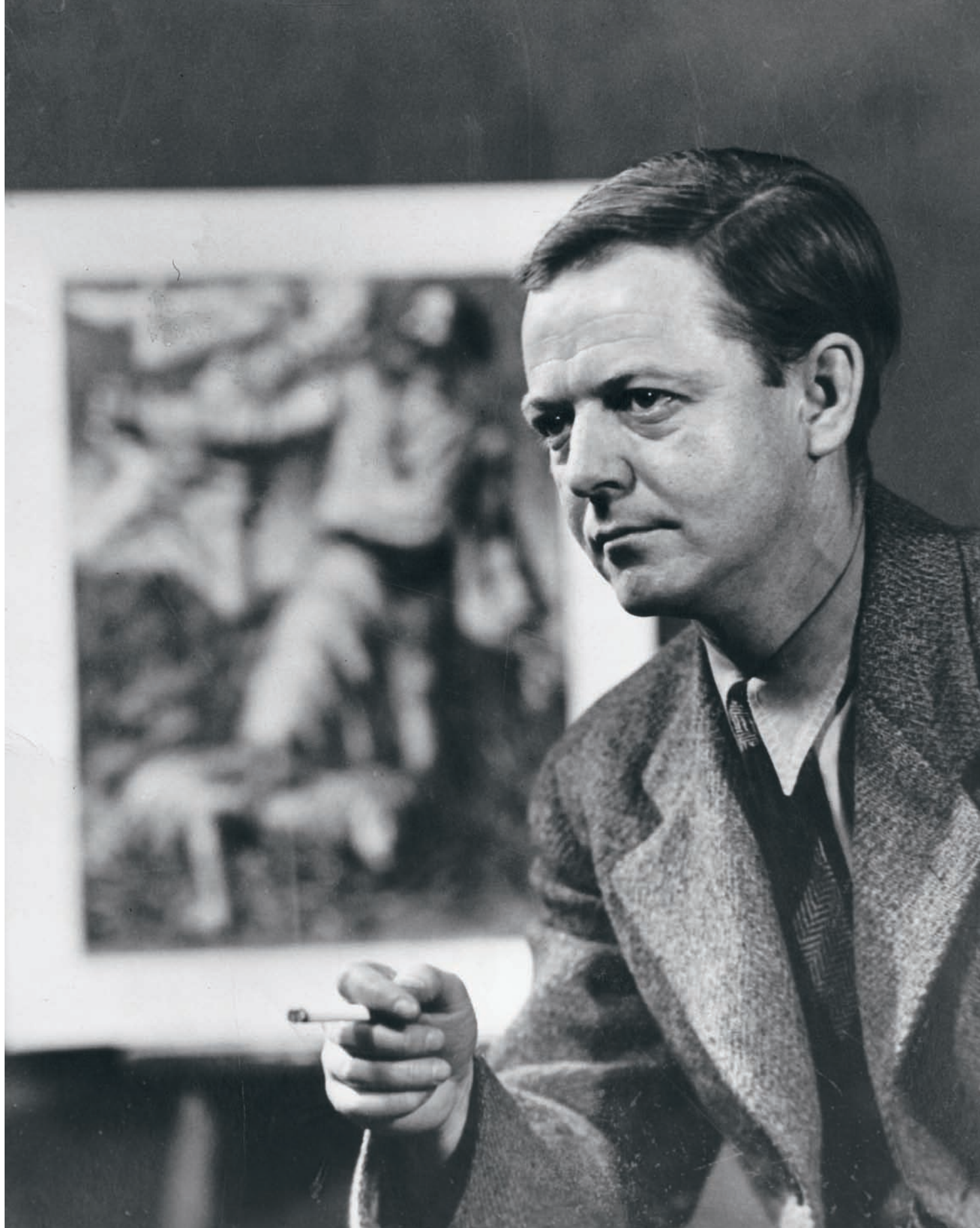
Miller Brittain , v. 1950 Collection de Murray Barnard